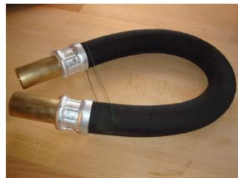
Courbe réduite possible

Aucun écrasement lors du cintrage, les pertes de charge sont quasiment inexistantes, même plié à l'extrême., grâce à la structure interne renforcée par la tige acier.