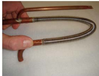
Int. tube inox annelé ((5bar)

Il est surtout utilisé pour les raccordements gaz