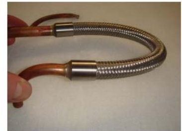
Ext. Tresse inox (25bar)