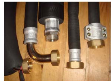
Divers raccordement sposs-