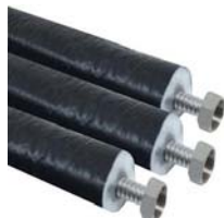
KS 2000 TLP