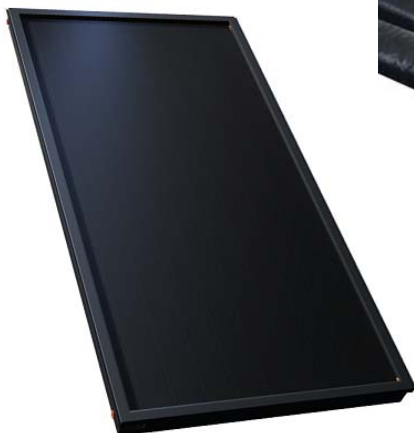
KS 2000 SLP